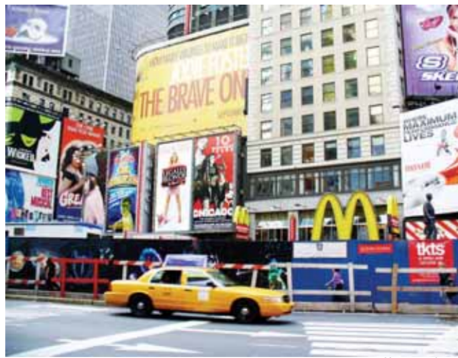
• متاجر ومطاعم

اليوم لا يزال سوق الاملاك في نيويورك قويا مدعوماً بالطلب الاجنبي وشح العرض. إلى حد الآن مشاكل سوق التمويل لم تؤثر على السوق العقاري في مدينة نيويورك، حيث ان حجم المبيعات