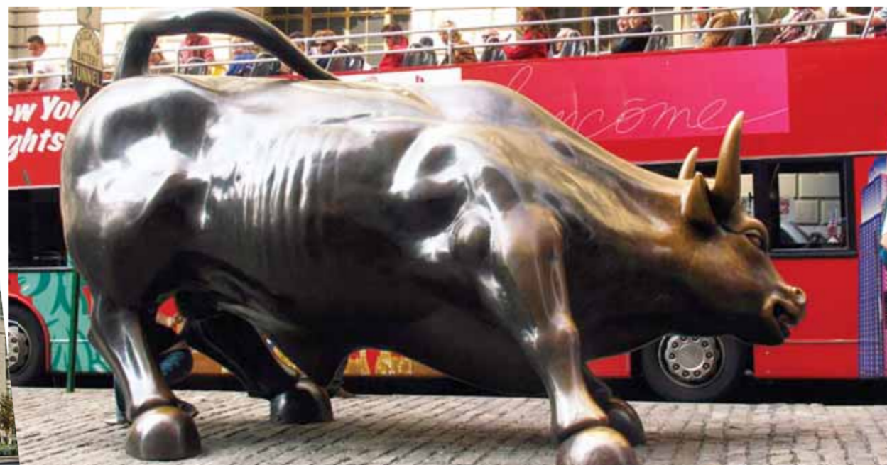
• وول ستريت

هي الاملاك التي تقع على سنترال بارك مباشرة او بالقرب منها مثل الفنت افنو Avenue Fifth وجنوب سنترال بارك Central Park Central بارك وجنوب غرب سنترال بارك Central Park West. بكل جدارة تعتبر هذه المنطقة اجمل وراقية جزء من نيويورك.