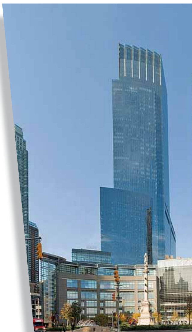
• أحد وجوه العصرية

- في البداية يأتون Borrowers Hedge الذين يستثمرون باموالهم الخاصة، ويجدهم يأتون Borrowers Speculative وهم الذين يملكون